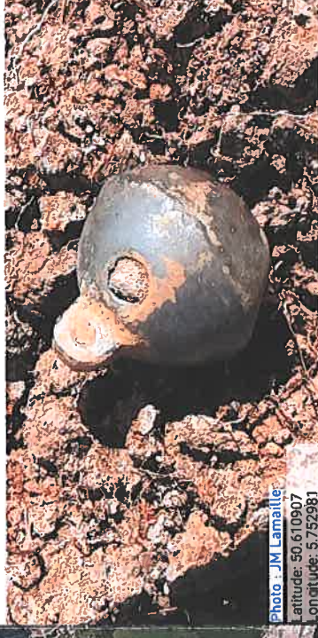
latitude: 50.610907 longitude: 5.752981