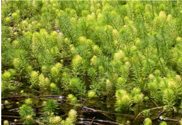
Figure 2: Myriophylle du Brésil ( Myriophyllum aquaticum )

En Wallonie, 7 espèces font actuellement l'objet d'un inventaire détaillé :