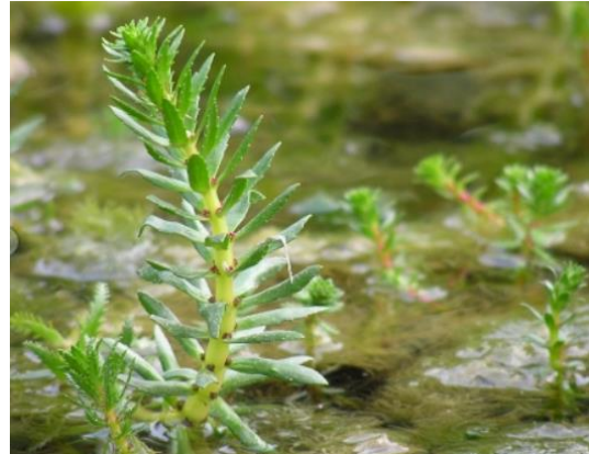
Figure 3: Myriophylle hétérophylle ( Myriophyllum heterophyllum )