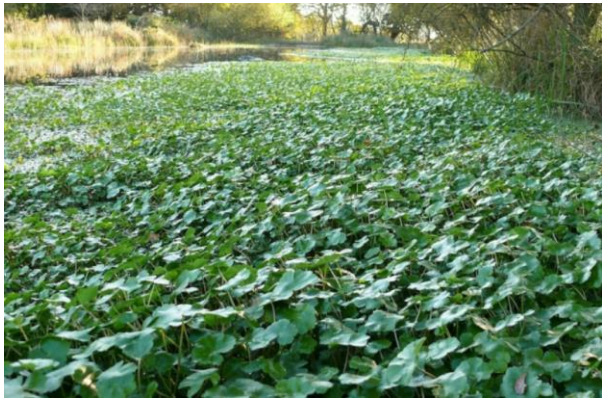
Figure 4: Hydrocotyle fausse-renoncule ( Hydrocotyle ranunculoides )