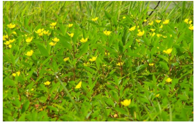
Figure 5: Jussie à Grande fleurs ( Ludwigia grandiflora ) et Jussie rampante ( Ludwigia peploides )