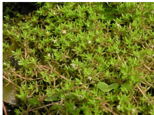
Figure 7: Crassule des étangs ( Crassula helmsii )