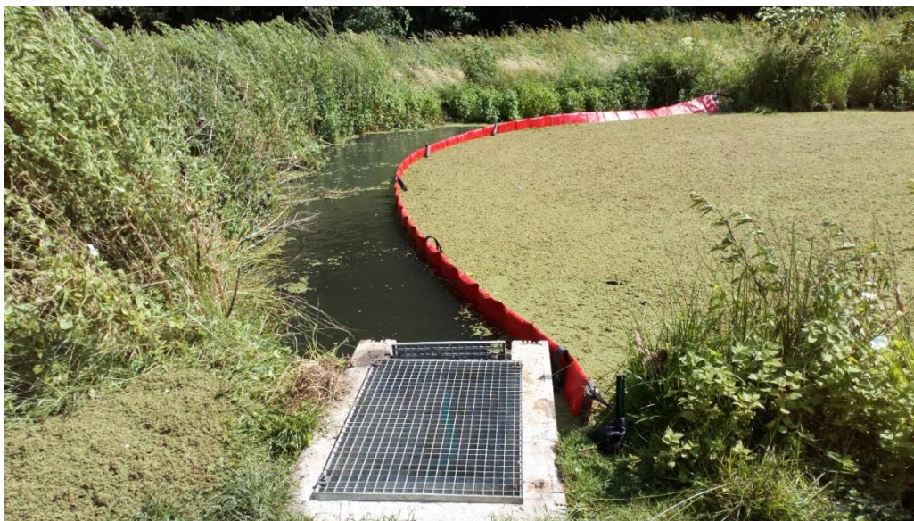
Figure 1: Azolla filiculoides envahissant l'étang du parc Nelson Mandela à Charleroi

Initialement importées pour leur pouvoir oxygénant, les plantes aquatiques exotiques envahissent les eaux de surface.